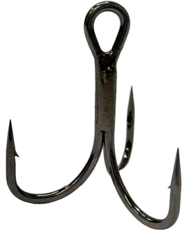
No.R21TR トレブルフック21,平打,鋼製,化学研磨付 規格表

トレブルフック21,平打,バープ付,TR(トリニティ・縦アイ) Treble Hook 21,Forged,Barbed,TR(TRINITY)