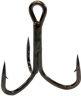
No.R68TR トレブルフック68,平打,鋼製,化学研磨付 規格表

トレブルフック68,平打,バープ付,TR(トリニティ・縦アイ) Treble Hook 68,Forged,Barbed,TR(TRINITY)