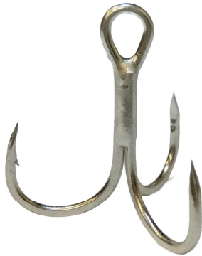
No.R72TR トレブルフック72,CP(槍先釣り針),平打,鋼製,化学研磨付 規格表

トレブルフック72,CP,平打,バープ付,TR(トリニティ・縦アイ) Treble Hook 72,CP,Forged,Barbed,TR(TRINITY)